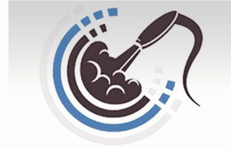
Sand blasting تنظيف الحديد بالترميل