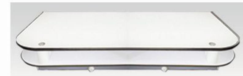
Optional: Double X ray translucent surface that allows full body scan

إختياري : سطح مزدوج منفذ للأشعة يسمح بإجراء المسح على كامل الجسم