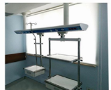
تعليق رفوف و ادراج Mounted shelves and drawer